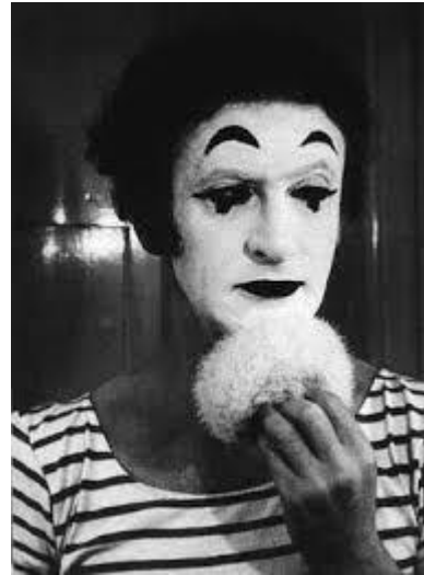
Le mime Marceau

C'est en général à Jean-Paul Gaultier que l'on associe la marinière.