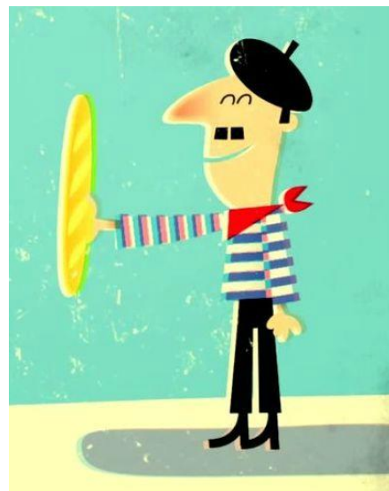
Cliché du Français