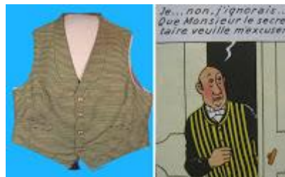
▲ à g. : Gilet de domestique, 1865, The Bowes Museum , Barnard Castle à dr. : Le valet Nestor, Objectif Lune , album Tintin, par Hergé, 1953, Casterman