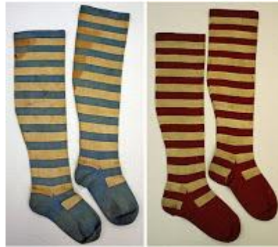
▲ Bas rayés, vers 1850, The Metropolitan Museum of Art, New York

Il n'exclut cependant pas que la marinière puisse être aussi un vêtement signalétique, permettant aux matelots d'être bien visibles lors des manoeuvres toujours dangereuses, ou mieux repérés s'ils tombent à la mer. Une troisième explication, ni symbolique ni utilitaire viendrait tout simplement des contraintes du mode de tissage par métier mécanique utilisé pour sa confection : la marinière est un tricot de dessous destiné à tenir chaud, et pendant longtemps, la bonneterie européenne a surtout produit sur des métiers circulaires des pièces de vêtements rayés (bas, chaussettes, bonnets, gants). A noter : le tricot rayé descend très bas, jusqu'à mi-cuisses. On dit aussi que la teinture indigo coûtant fort cher, on aurait alterné le blanc et le bleu par souci d'économie.