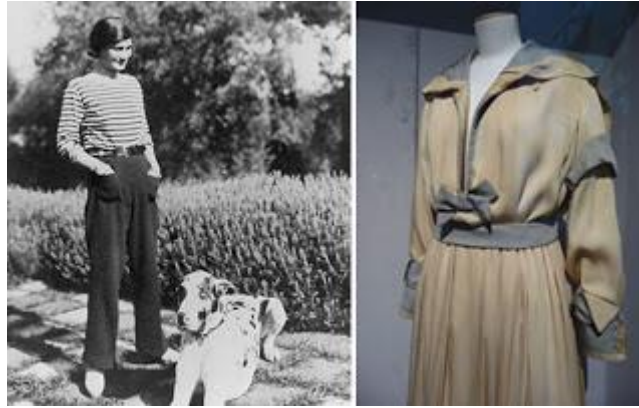
▲ à g. Gabrielle Chanel en pantalon à pont et tricot rayé, vers 1930 à dr. Costume marin en tricot, par Gabrielle Chanel, 1917 sur Les Marins font la mode, Musée national de la Marine