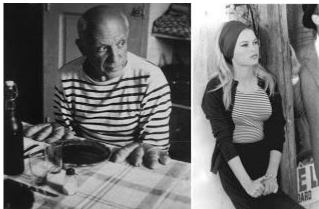
▲ Pablo Picasso, par Robert Doisneau Brigitte Bardot dans Le Mépris, film de Jean Luc Godard, 1963

Dans les années 1950 et 1960, la marinière est adoptée par les intellectuels et les artistes, comme Pablo Picasso et Brigitte Bardot sur la Côte d'Azur. En 1962, Yves Saint Laurent est le premier à créer des tenues extrêmement élégantes inspirées du marin, dont une marinière. Cela deviendra un exercice de style pour les couturiers et les créateurs. Jean Paul Gaultier en fait son vêtement fétiche, la rayure devient un des codes de la marque. Le tricot rayé ne s'est pas seulement contenté de passer dans l'habillement civil, il est devenu une icône de mode.