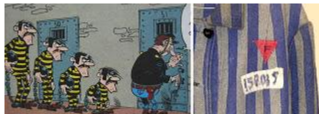
▲ à g. : Les frères Dalton dans Le Magot des Dalton , Lucky Luke, 1998, Dargaud à dr. : Tenue de déporté d'un camp de concentration nazi, 1945