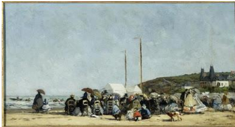
▲ La Plage de Trouville par Louis Eugène Boudin, 1864, Musée d'Orsay

Tous ces usages anciens de la rayure vont curieusement fusionner aux XIXe et XXe siècles, lorsque la société européenne découvre les plaisirs des bains de mer et de la plage. Dès la fin du second Empire, on trouve cette mode des tissus et vêtements rayés sur les plages normandes, telles que les peint par exemple Eugène Boudin.